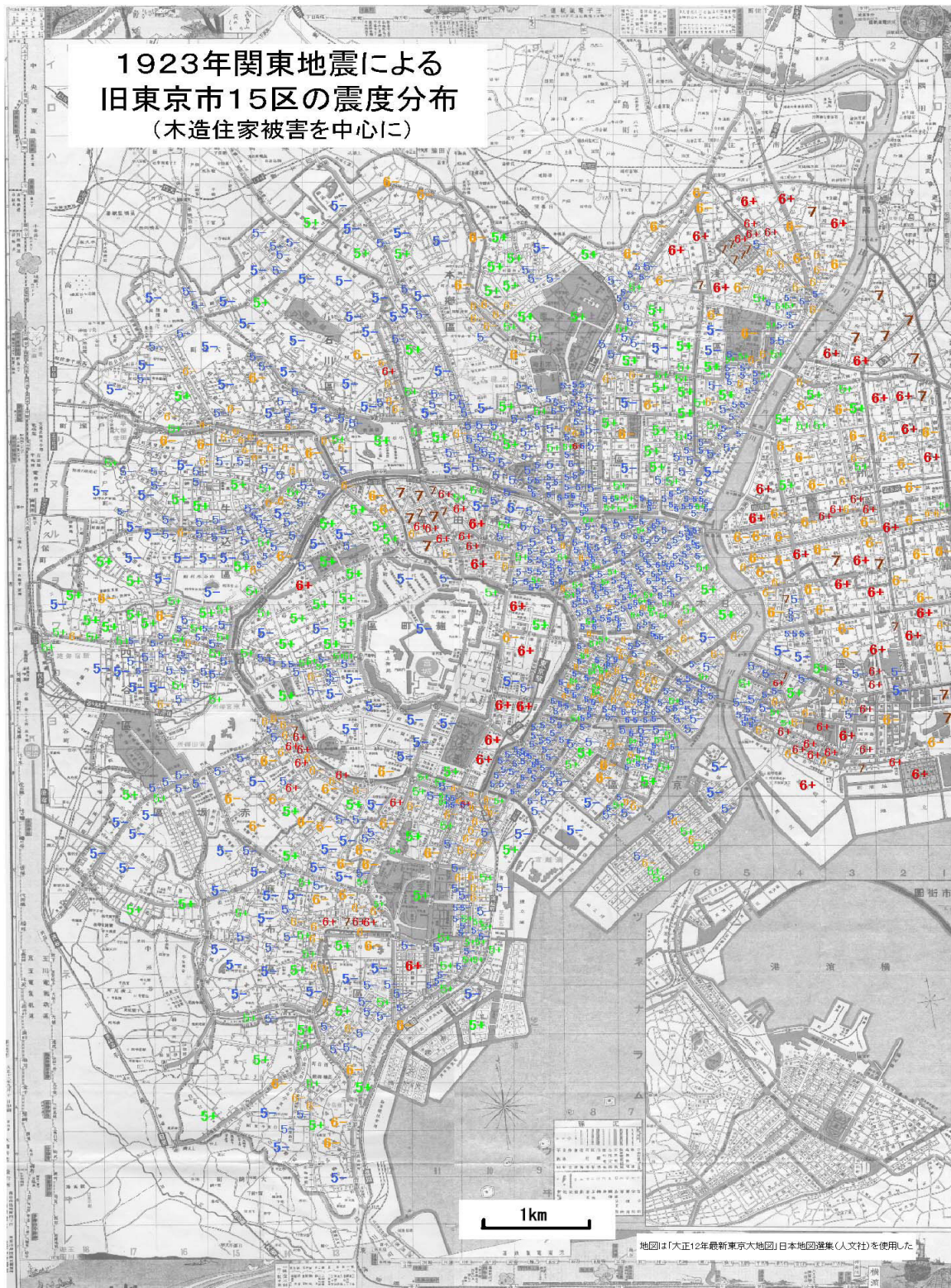
図1 関東地震直前の東京市の地図にプロットした町丁目毎の震度。地図は文献15) によった。

基本原則のほか、①-③は、松澤 1) による全潰率Y以外の情報から震度がさらに大きいのではないかと推定される場合の対応、④は松澤データの欠落で震度を過小に評価する町丁目を少なくするため、⑤-