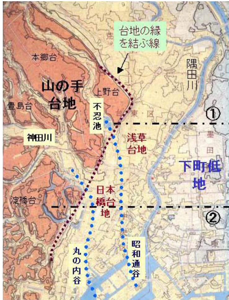
図3 東京の地形の概観図。①②は図4に示す地盤の断面図の位置。文献16)の図に加筆。