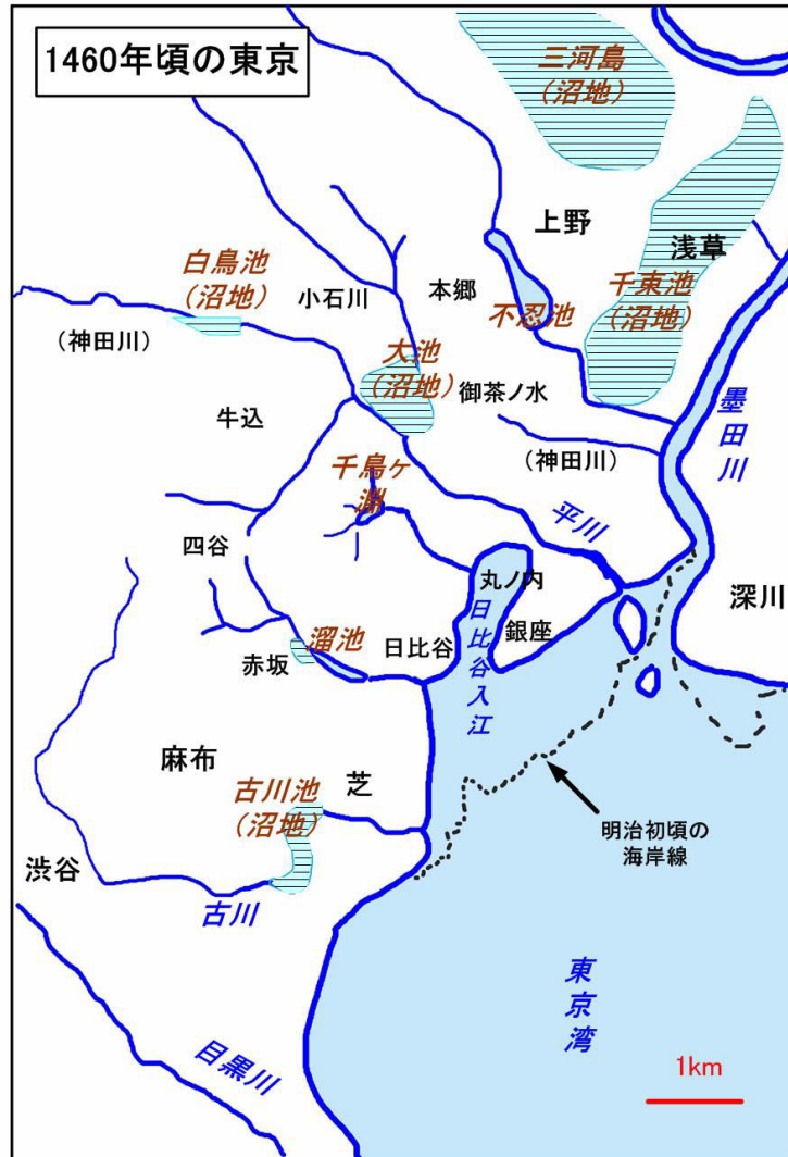
図2 1460年頃の江戸の地形。文献17)により作成。