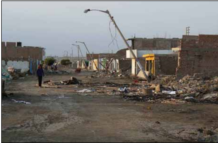
写真1 タンボ・デ・モラの街路の被害の様子．街は液状化によって，70cm以上沈下し，90%以上の建物が影響を受け，5人の死者が出るなど，大きな被害を受けた．