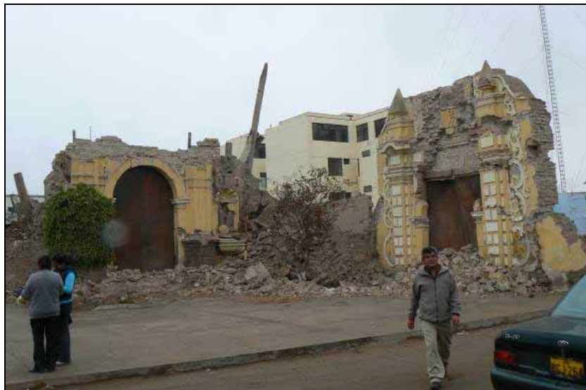
写真2 Compañia de Jesus 教会 (Pisco)の被害の様子．この教会での死者数は今地震による全死者数の30%を占める