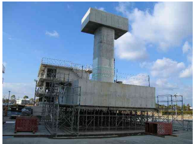
試験体外観(平成22年1月9日現在)