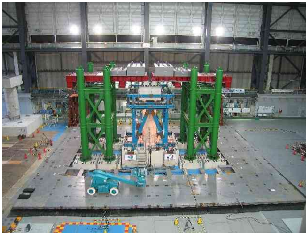
平成20年度橋梁実験時写真(見かけ上は試験体外観に大差がありません)

実験で得られたデータは、橋梁分野の耐震研究者に提供され、橋梁の耐震設計や学術的研究への活用が期待されます。なお、本実験後に橋脚がさらに加震実験可能な状態であれば、3月2日に実験を予定しています。