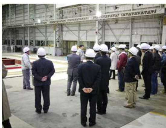
写真7 防災科学技術研究所・大型振動台の見学風景