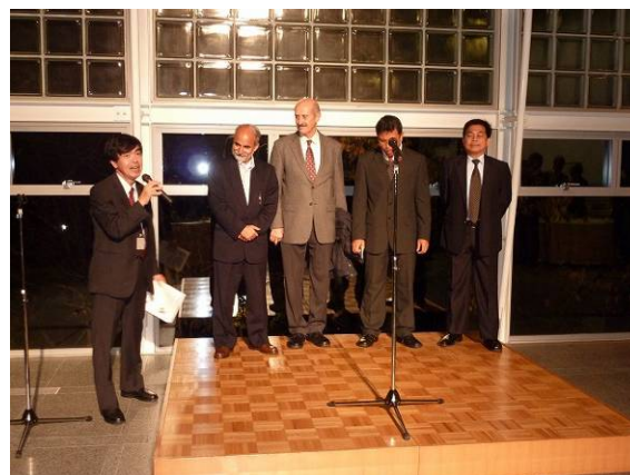
写真5 国際PDパネラーの紹介