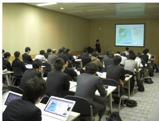
写真6 早わかり講義の受講風景

シンポジウム運営委員会は、日本地震工学会を中心に12の関係各協会から参加いただいた運営委員29名で構成されました。約2年前から準備に取りかかり、つくば国際会議場との打ち合わせ、特別講演、国際パネルディスカッション、スペシャルテーマセッション、早わかり講義、技術展示および筑波研究学園都市地震工学ツアーなど、一般プログラム以外の企画にも精力的に取り組んで参りました。その甲斐あって、投稿論文数、参加者ともに前回は上回り、盛大なシンポジウ