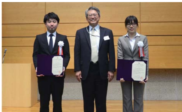
論文奨励賞受賞者